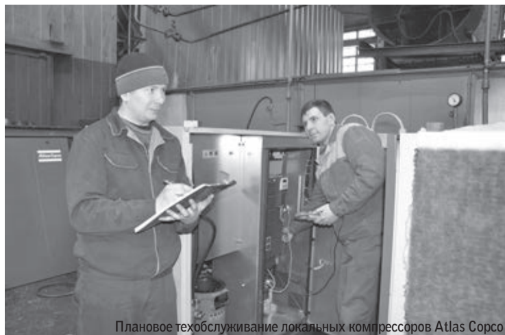
Плановое техобслуживание локальных компрессоров Atlas Copco