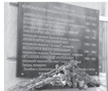
«Никто не забыт...»