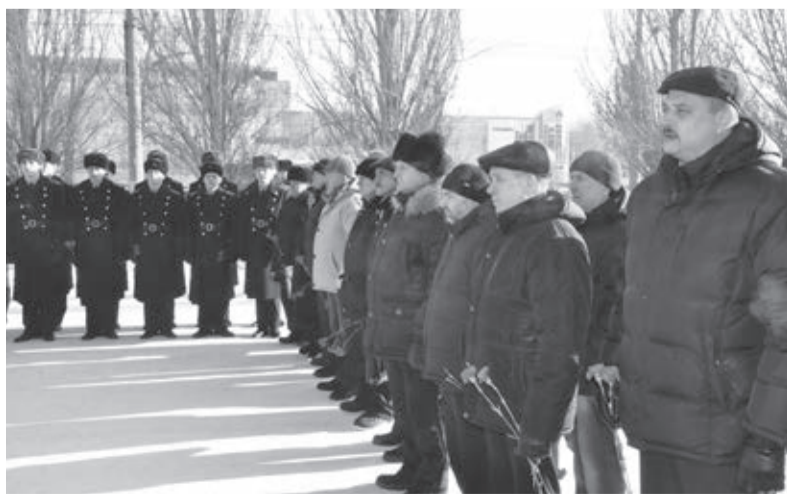
Звучит гимн России

чествование воинов-интернационалистов, которое прошло во Дворце культуры машиностроителей 19 февраля. Представители администрации КМЗ и ЗКЛЗ, профсоюзного комитета, городской Думы и областного военкомата тепло поздравили заводских «шурави» и вручили им памятные медали и благодарственные письма.