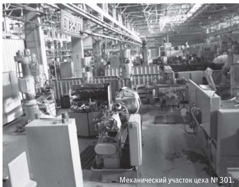
Механический участок цеха № 301.