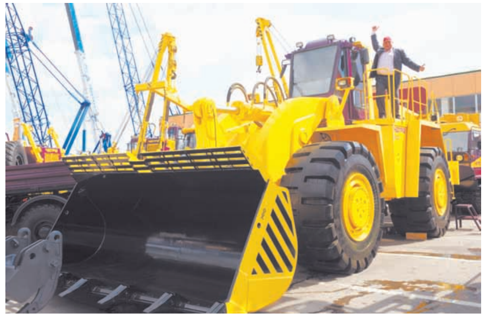
Тяжелый фронтальный погрузчик ЧЕТРА ПК120