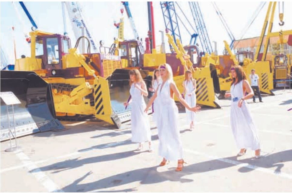
На открытии экспозиции ЧЕТРА