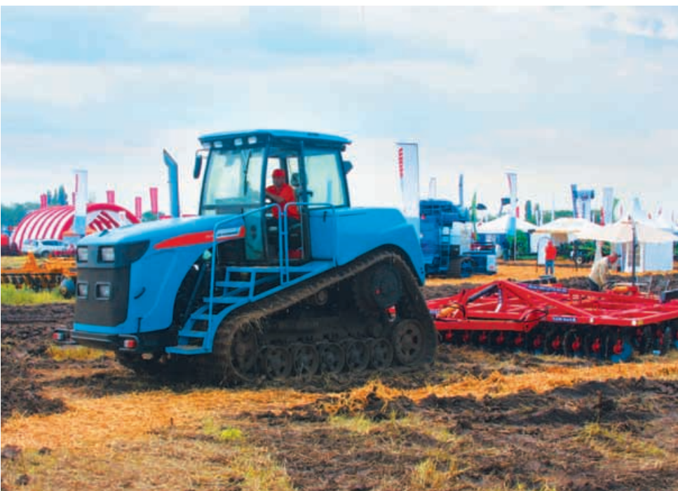
На выставках 315ТГ «пашет» по просьбе потребителей