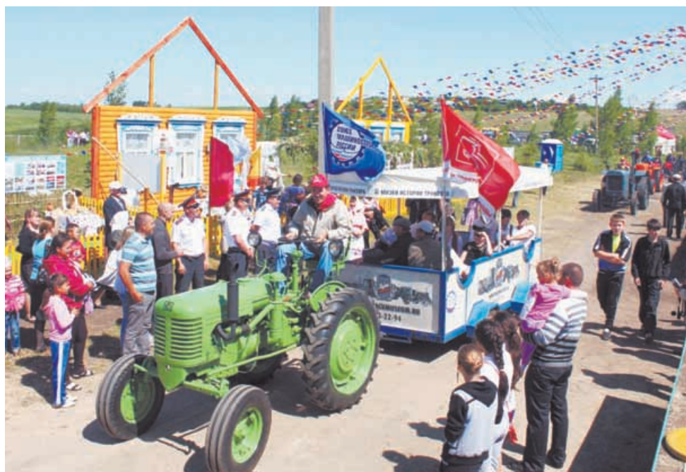
Встреча тракторного пробега в Канашском районе Чувашии

Было решено пройти по местам развития машинно-тракторных станций (МТС) под девизом «Восстановим, сохраним и приумножим тракторную историю!». В пробеге участвовали тракторы первой половины – середины XX века, восстановленные усилиями работников музея, Промтрактора и студентов Чебоксарского электромеханического колледжа: СТЗ