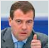
Дмитрий МЕДВЕДЕВ, Президент России

Конструкторские бюро (КБ) «Концерн «Тракторные заводы» в рекордно сжатые сроки осуществляют проектирование новой продукции, расширяя и модернизируя продуктовые линейки. О компетенциях и результатах кооперированного подхода к разработке отечественной тракторной техники нового поколения рассказывают руководители наших КБ.