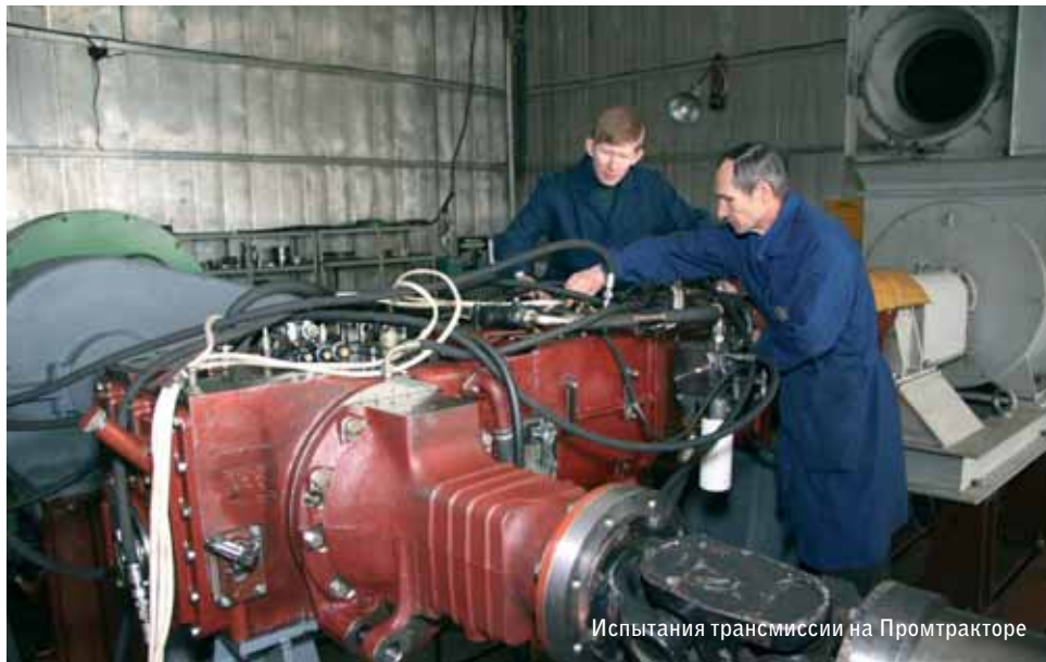
Испытания трансмиссии на Промтракторе