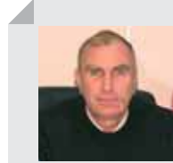
ОАО «ГСКБ ХС» (г. Чебоксары)

Использование компьютерного проектирования, начавшееся десять лет назад, многократно повысило эффективность труда конструкторов при разработке пространственных металлоконструкций. Применение трехмерного проектирования упростило проверку