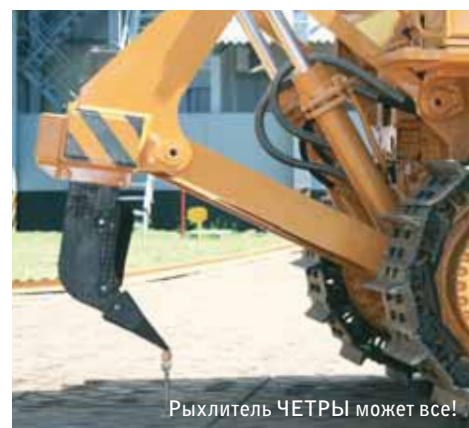
Рыхлитель ЧЕТРЫ может все!

Сергей КАССИХИН, начальник отдела гусениц и ведущих колес ГСКБ ХС