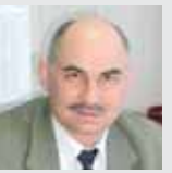
ОАО «ГСКБ» (г. Чебоксары)

Гости с опаской садятся в кабину 50-тонного гиганта ЧЕТРА, а после тест-драйва восторгаются: «Какая послушная машина! Этот бульдозер легко управляется одним пальцем!» Джойстик давно заменил в российском тяжеловесе трудноуправляемый рычаг.