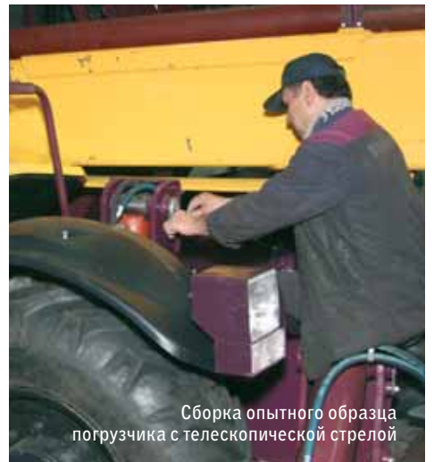
Сборка опытного образца погрузчика с телескопической стрелой

Машина приобрела уникальные преимущества в сравнении с другими аналогами. Это подъем грузов, причем любой конфигурации, от 4 тонн до 250 кг на высоту до 13 метров. Гидрообъемное рулевое управление, имеющее несколько режимов работы: для перемещения по дорогам можно использовать только передний привод, для максимальной маневренности поворот осуществляется всеми колесами, погрузчик может даже двигаться «крабом», для параллельного