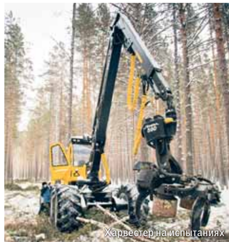
Харвестер на испытаниях

В перспективе запланирована разработка гусеничного экскаватора ЭГП-270