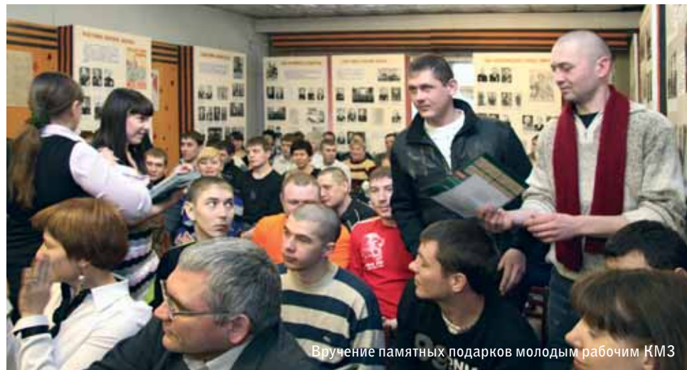
Вручение памятных подарков молодым рабочим КМЗ

– Отрадно видеть, что престиж профессий машиностроительной направленности вновь начинает расти, – подчеркнул Игорь Гиске, председатель Курганского регионального отделения Союза машиностроителей России, исполнительный директор Курганмашзавода. – Ваша энергия, знания, до-