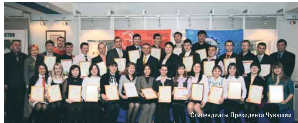
Стипендиаты Президента Чувашии

Поначалу герои дня были несколько растеряны. Но мощный положительный настрой, который чувствовался в выступлениях, стирал недоверие с лиц. Каждого молодого рабочего здесь назвали поименно, вручили календари с пожеланиями успехов в труде и призывом дорожить званием заводчанина. И было ощущение, что все они вливаются в большую дружную заводскую семью, где им рады, где их ждут!