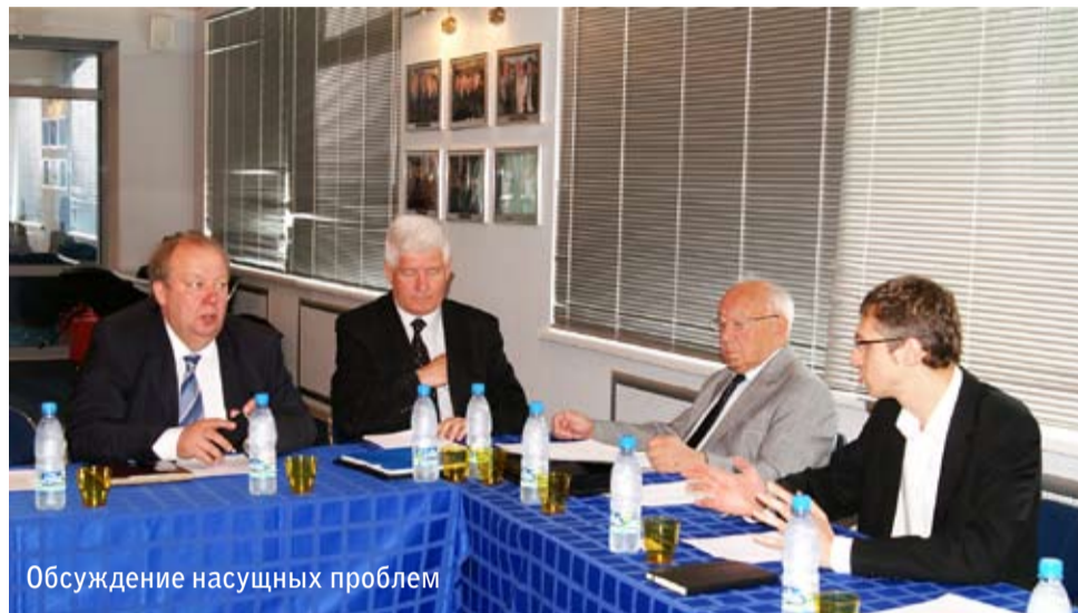
Обсуждение насущных проблем

поставки, после многих лет затишья, интенсивно возобновляются, уже в этом году большая партия тракторов отправлена в Монголию, ближайший контракт обсуждаем с Йеменом, Нигерией, Венгрией, так что былая слава возрождается. Кстати, любопытный факт в истории российского тракторостроения: за переход до Владивостока и обратно владимирский трактор отмечен в Книге рекордов Гиннеса.