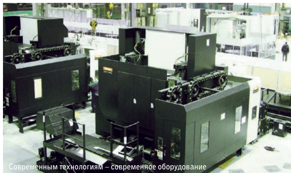
Современным технологиям – современное оборудование