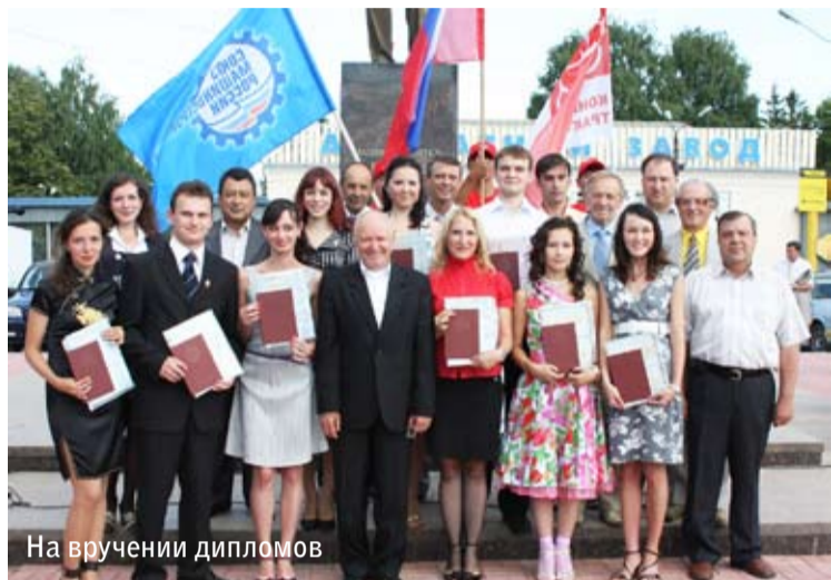
На вручении дипломов

Еще несколько лет назад студенты о таком и не мечтали. Сегодня же, несмотря на кризис, конкурс на технические специальности в российские вузы начинает сравниться с престижными гуманитарными факультетами, а за их выпускниками начинается настоящая охота. Сегодня вопрос смены инженерных кадров практически превращается в вопрос нормального функционирования предприятий. На предприятиях машиностроительной группы «Тракторные заводы», где бережно относятся к традициям, но при этом смотрят в будущее и готовы к инновационным переменам, делают все возможное для привлечения на предприятия перспективной молодежи. Да и талантливые выпускники российских технических вузов с удовольствием проходят практику и идут работать на предприятия одного из самых крупных в России машиностроительных холдингов.