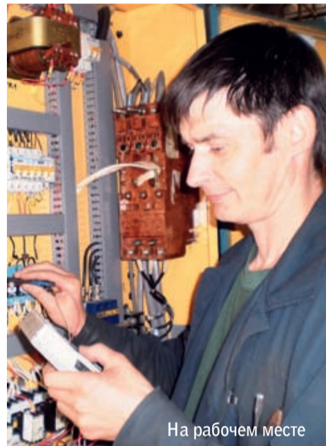
На рабочем месте

Покачивание несущегося в ночи поезда располагало к мечтам, и мысли незаметно свернули к любимому увлечению: «Машину бы новую не мешало