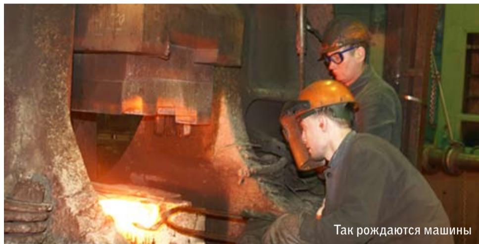
Так рождаются машины

- Кадровый вопрос нужно решать, причем в достаточно сжатые сроки. Иначе, даже если наши заводы и проведут