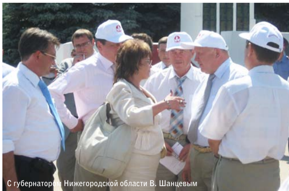
С губернатором Нижегородской области В. Шанцевым

- Вопрос взаимодействия с банками, пожалуй, самый сложный. Не секрет, что многие программы по развитию предприятий, созданию нового продукта реализовывались за счет заемных и собственных средств. Это нормальная практика. Благодаря этой практике мы достигли хороших результатов. С 2005 года объем инвестиций составил 13 миллиардов рублей, из них более 8 миллиардов было направлено на развитие производственных мощностей. Разработано 28 моделей