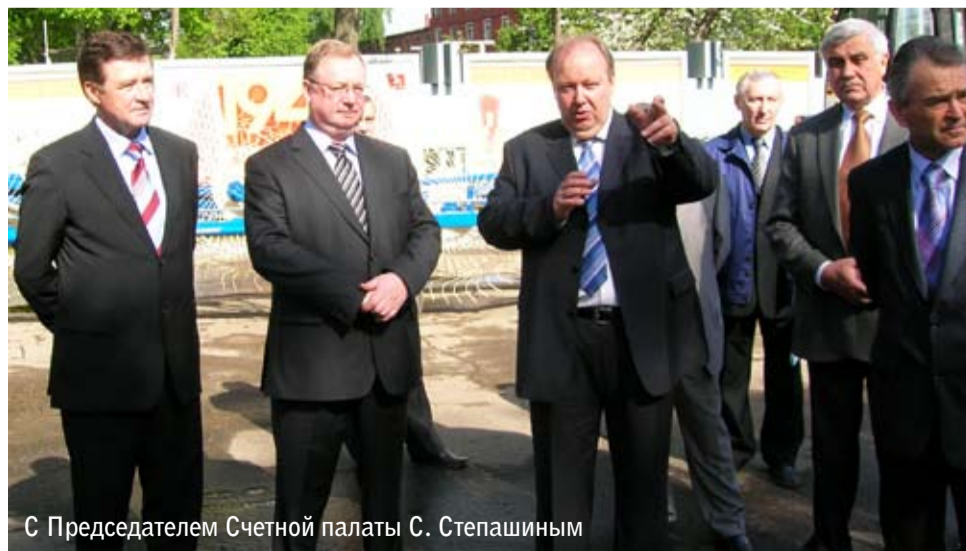
С Председателем Счетной палаты С. Степашным