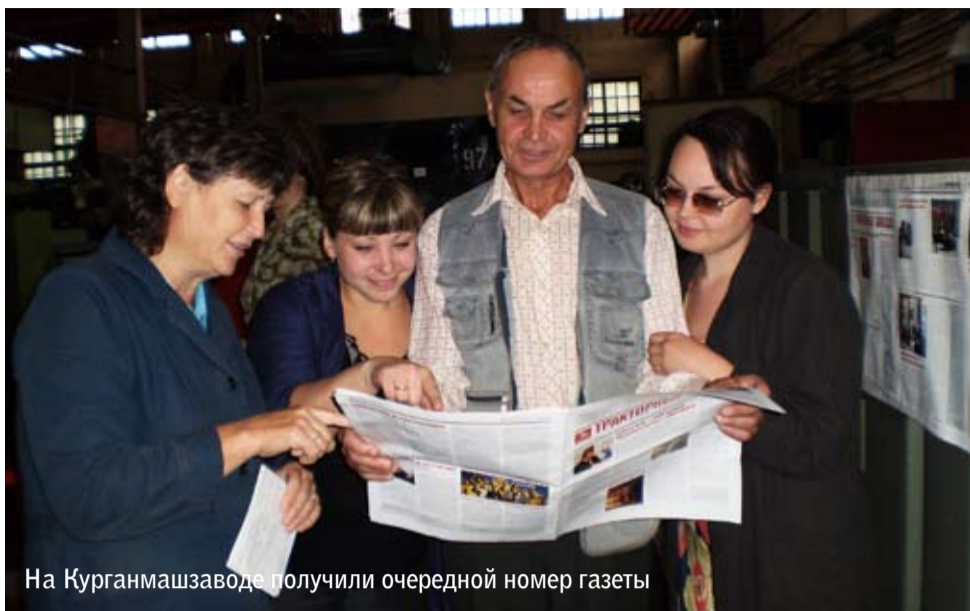
На Курганмашзаводе получили очередной номер газеты