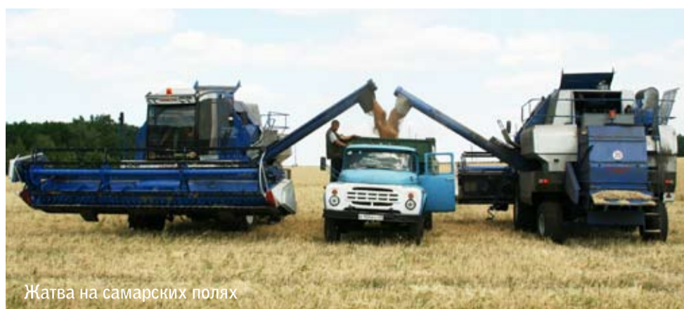
Жатва на самарских полях