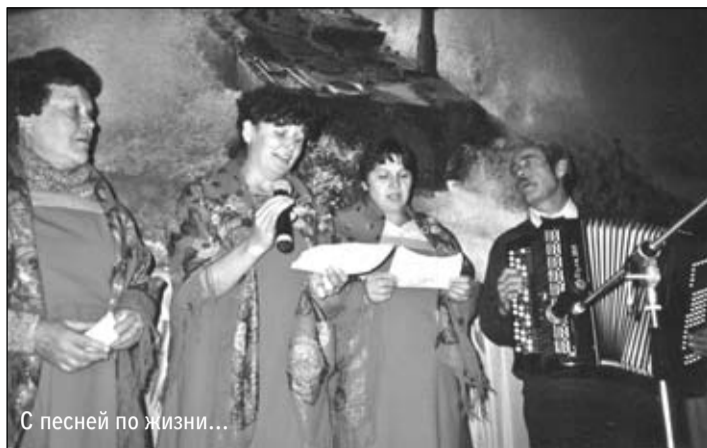
С песней по жизни...