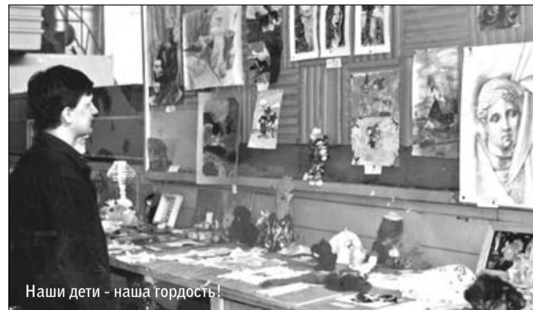
Наши дети - наша гордость!