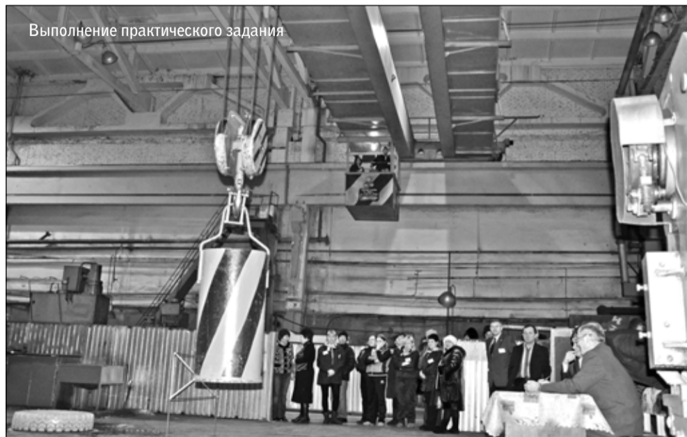
Выполнение практического задания