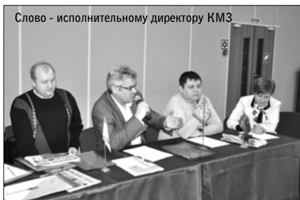
Слово - исполнительному директору КМЗ

Активистов форума по итогам мероприятия отметили грамотами предприятия и дипломами Курганского регионального отделения СМР.