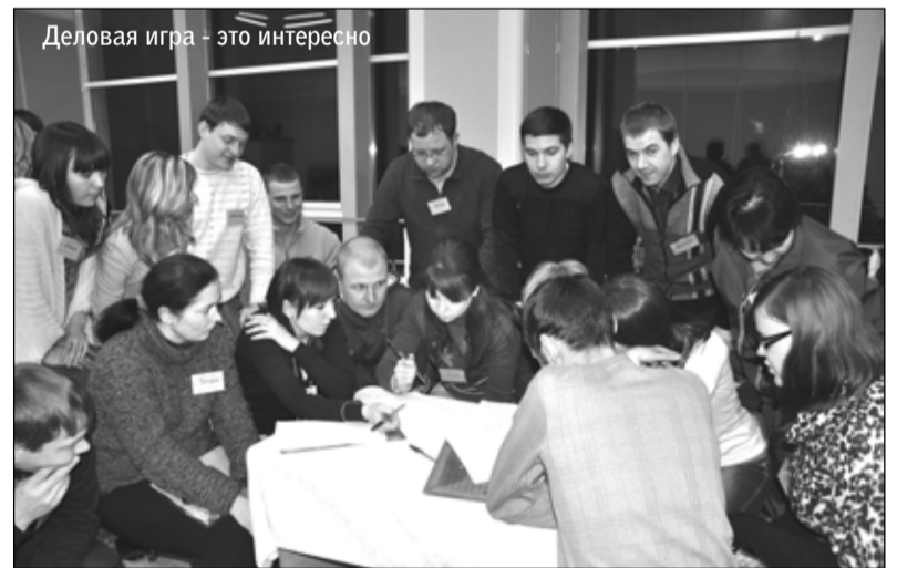
Деловая игра - это интересно

Молодые люди не просто обозначили проблемы, которые они видят на производстве, но и предлагали конкретные пути их решения. С чем-то руководители соглашались, поддерживая инициативу, некоторые вопросы вызвали жаркие дискуссии, но конструктивные решения в итоге все