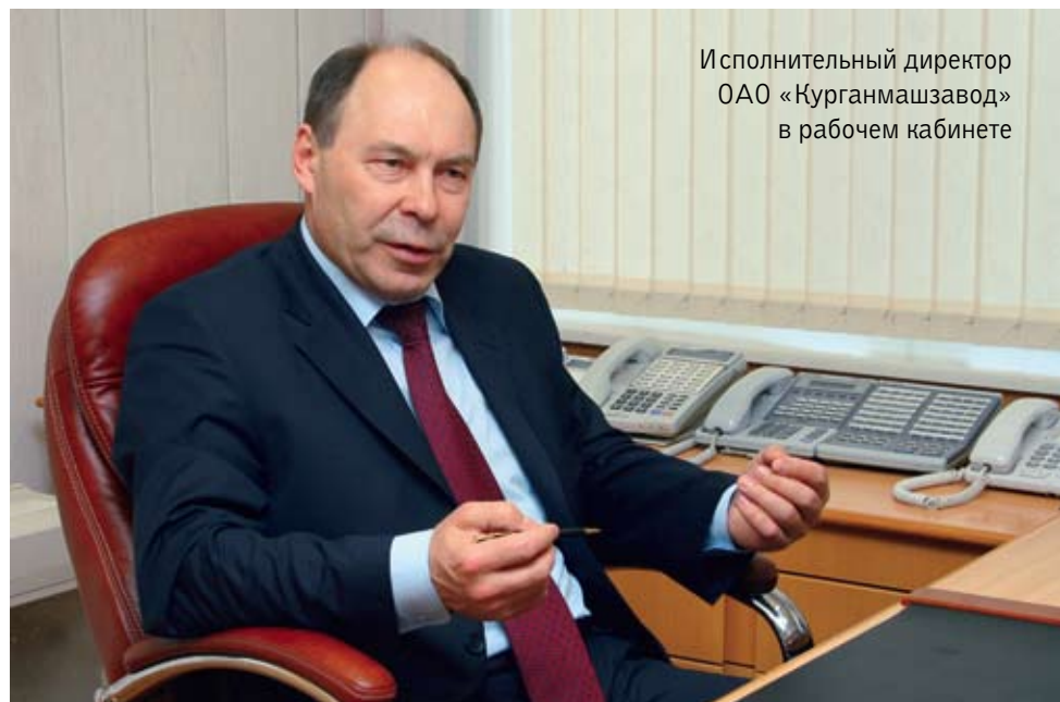
Исполнительный директор ОАО «Курганмашзавод» в рабочем кабинете