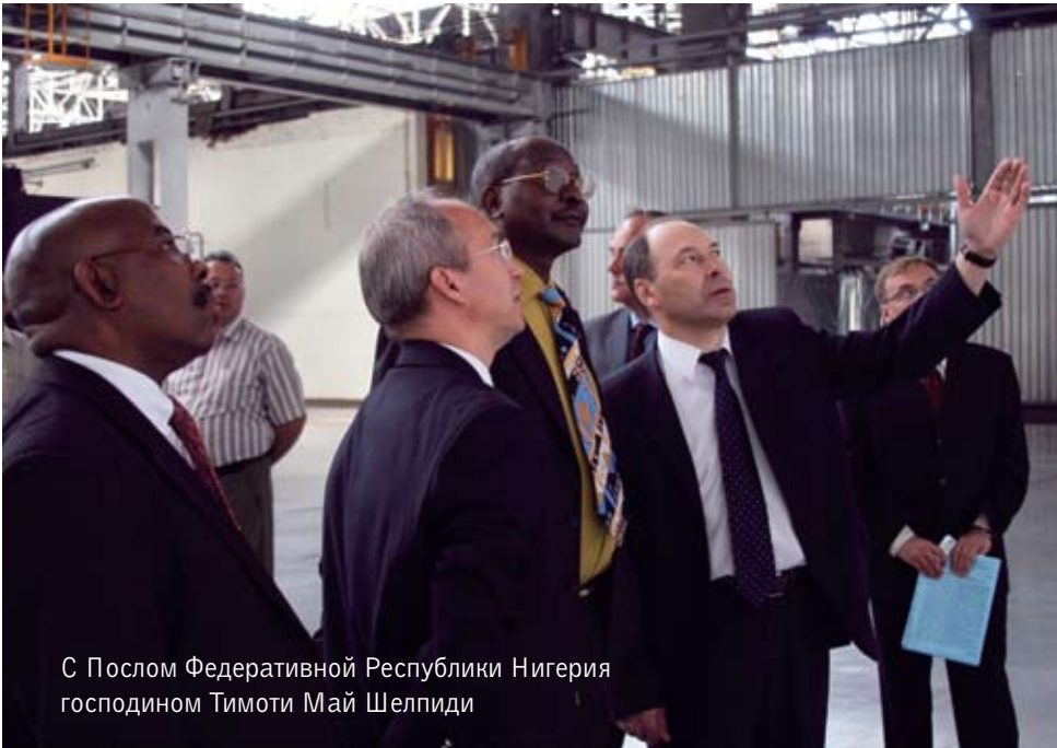
С Послом Федеративной Республики Нигерия господином Тимоти Май Шелпиди