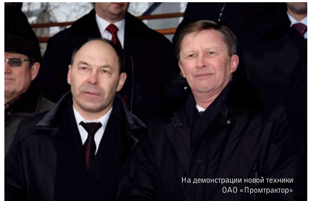
На демонстрации новой техники ОАО «Промтрактор»