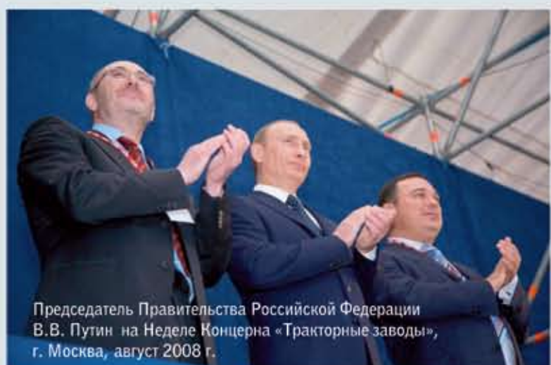
Председатель Правительства Российской Федерации В.В. Путин на Неделе Концерна «Тракторные заводы», г. Москва, август 2008 г.

«Концерн «Тракторные заводы» – крупнейший производитель внедорожной техники, оборудования и деталей для тяжелого и легкого машиностроения, продукция которого представлена в ключевых секторах экономики России и мира.