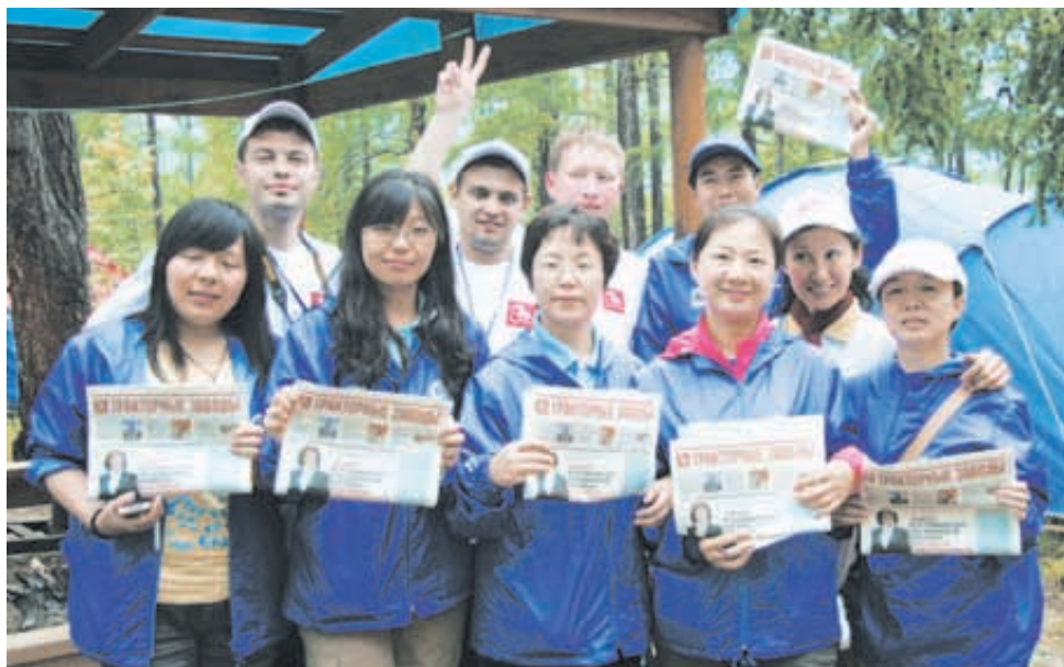
Коллеги из Китая увезут с собой газету «Тракторные заводы»

Специалисты крупнейшей машиностроительной ассоциации Китая (Chinese Mechanical Engineering Society) представили своим коллегам из России дорожную карту развития промышленности своей страны на 20 лет вперед. С большой гордостью они рассказали о реализуемых правительством Китая программах по развитию индустриального сектора страны. Представители Концерна «Тракторные заводы» получили в дар от китайской делегации различные подарки и материалы, рассказывающие о деятельности ведущих технических учреждений и профессиональных ассоциаций Китая.