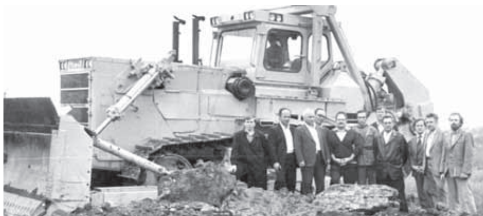
Завершение испытаний трактора Т-500 (1981 год)