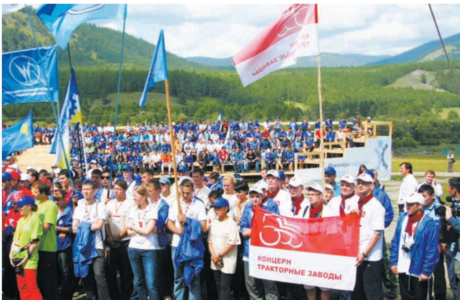
Байкал собрал инженеров завтрашнего дня