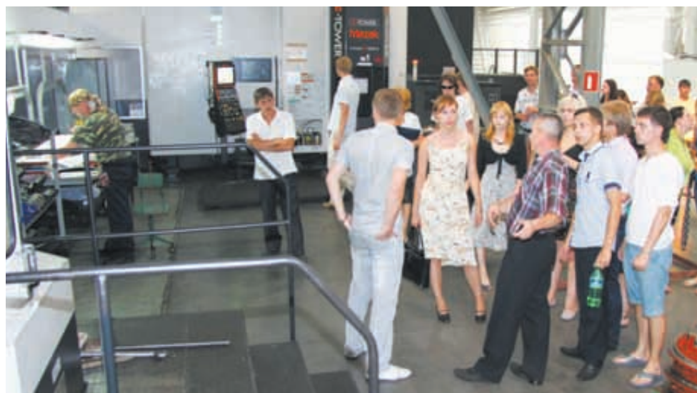
Ученые и студенты технических вузов России на Промтракторе