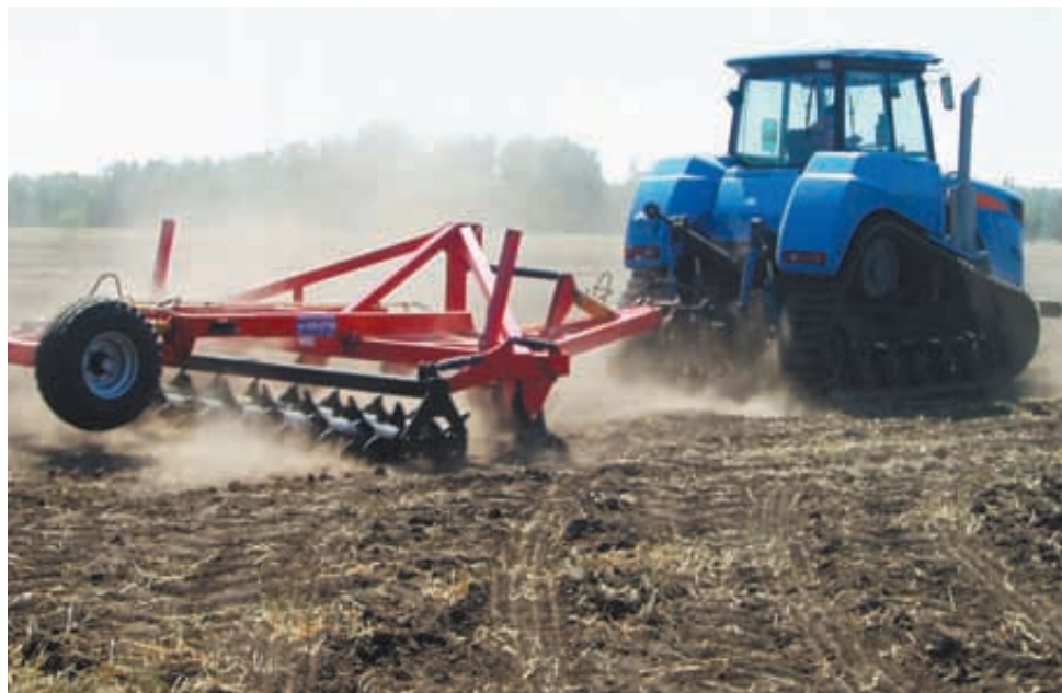
АГРОМАШ 315ТГ на Дне Алтайского поля

Успешным для Агромашхолдинга стал День сибирского поля-2012 в окрестностях поселка Прутский Павловского района Алтайского края. О значимости мероприятия можно судить по участию 130 отечественных и зарубежных компаний, представивших 450 единиц техники сельскохозяйственного назначения.