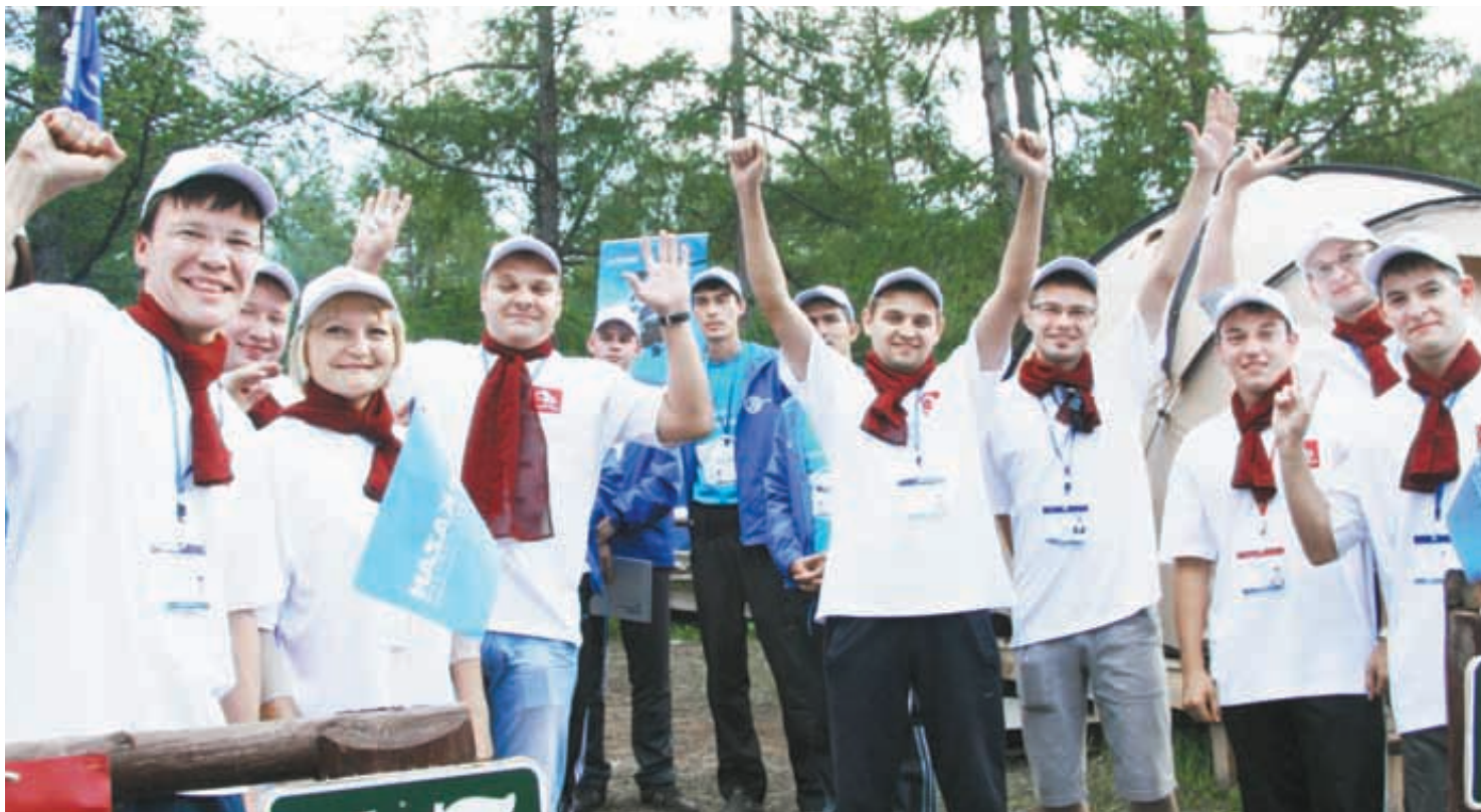
Команда представителей Концерна «Тракторные заводы»

Чтобы перейти от слов к делу, российская делегация взяла на себя обязательства по предоставлению комплектующих к пилотной сборке бульдозера, а китайская делегация любезно дала согласие на локализацию производства на территории их палаточной стоянки в лесу. Под аккомпанемент студента-скрипача из Китая, хохот и бурные аплодисменты молодые инженеры из России за считанные секунды из своих тел собрали первую машину марки «Friendship-ЧЕТРА», которая в рамках Форума-2012 стала символом укрепления делового и культурного сотрудничества двух стран.