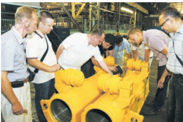
Студенты на практике в цехах Промтрактора