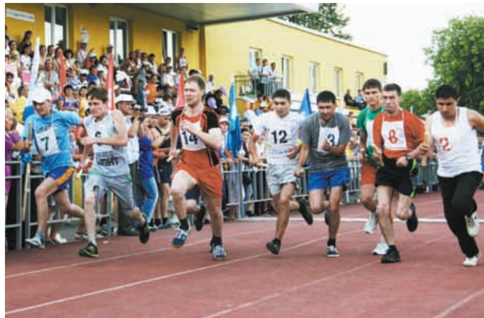
Старт эстафеты мужских команд