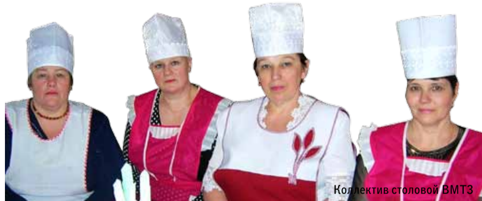
Коллектив столовой ВМТЗ

В меню заведения уже немало фирменных блюд, созданных на основе домашних рецептов: рулетки, булочки в