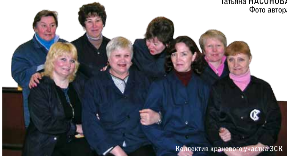
Коллектив кранового участка ЗСК