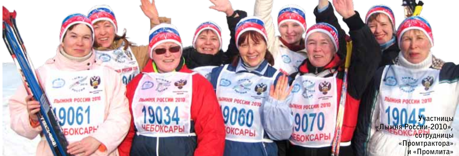
Участницы «Лыжня России-2010», сотрудницы «Промтрактора» и «Промлита»

порцию адреналина, лыжники за богатым чайным столом делились впечатлениями. Эмоции били через край, группа походила на пчелиный рой – сплошной стукоток энергии!