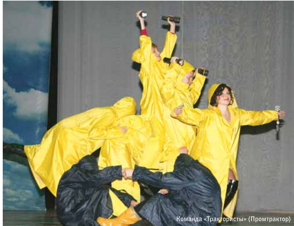
Команда «Трактористы» (Промтрактор)

Безраскосная телескопическая тележка кареты с подрессоренной балансирной балкой и новыми толкающими брусками большого сечения повышенной прочности и жесткости сделают ваше новогоднее путешествие безопасным и незабываемым.