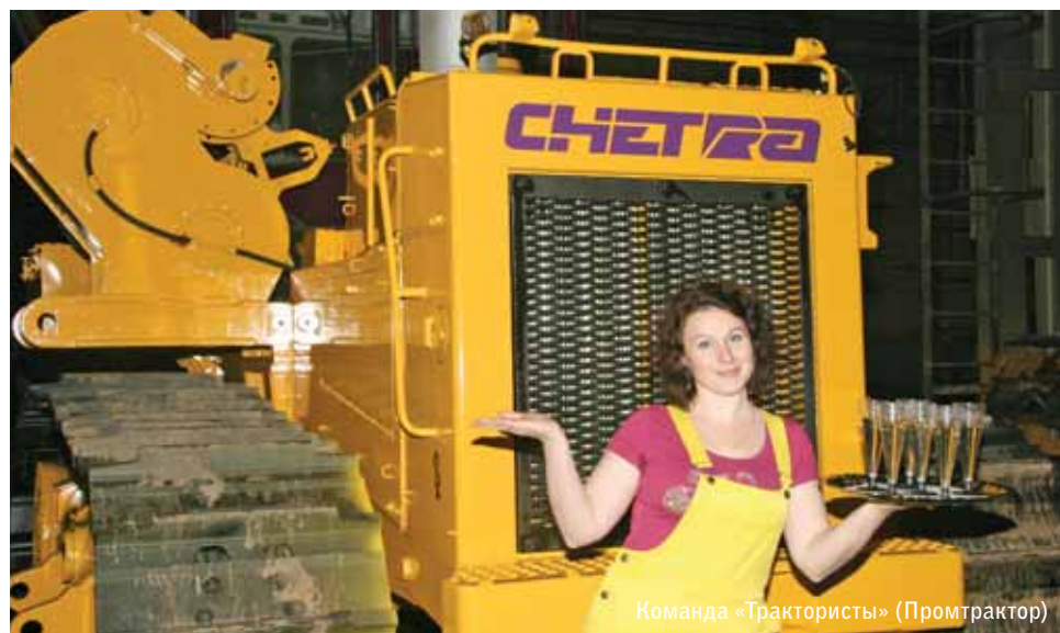
Команда «Трактористы» (Промтрактор)