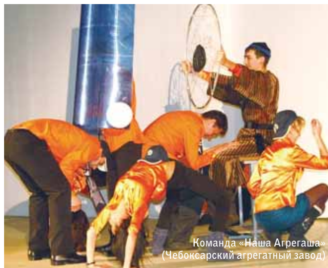
Команда «Наша Агрегаша» (Чебоксарский агрегатный завод)