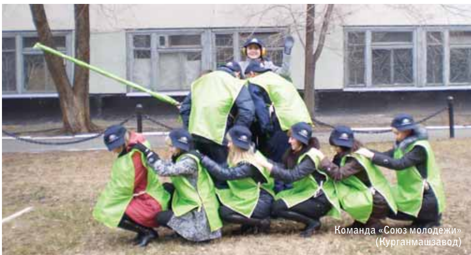
Команда «Союз молодежи» (Курганмашзавод)

дали курганские конструкторы и производственники. Она и внешне от нас отличается – похорошела – слов нет! В выносливости и умелости с ней еще потягаться. Думаете, завидуем? Ничуть! Хорошо, что есть светлые и мудрые люди, которые умеют создавать такие машины.