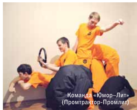
Команда «Юмор-Лит» (Промтрактор-Промлит)

У меня каждая рабочая часть осна- щена отдельным электродвигателем, поэтому затруднение в работе одного из рабочих узлов не отражается на работе других. Желаю вам в наступающем году эффективной, бесперебойной работы.