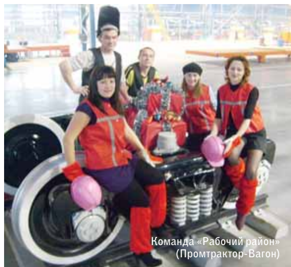
Команда «Рабочий район» (Промтрактор-Вагон)

Мы гусеницы – родом из России, Для техники Komatsu и Hitachi. И вас от нас поздравить попросили, Что, в общем-то, нелегкая задача. Как наша сталь прочна и долговечна, Так вам желаем долгие мы лета! И наша с потребителями встреча Пусть радует, как в темном царстве свет! Поверхностей вам трущихся убавить, Защиты вам от «агрессивных сред» И полной герметичностью избавить Себя от неприятностей и бед! Пусть будут долговечными шарниры И в доме только летная погода! Пусть правильными будут ориентиры! Привет от гусениц! Успехов! С Новым годом!