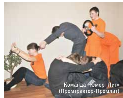
Команда «Юмор-Лит» (Промтрактор-Промлит)

Оцените мои достоинства: высокую скорость, маневренность, усиленный манипулятор и ходовые качества. Мне не страшна и суровая непроходимая тайга! Желаю вам стойкости, стабильности и уверенности во всех начинаниях!