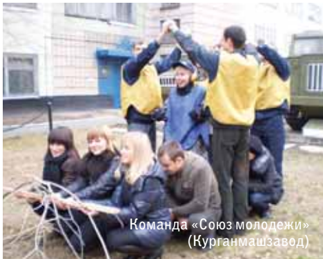
Команда «Союз молодежи» (Курганмашзавод)