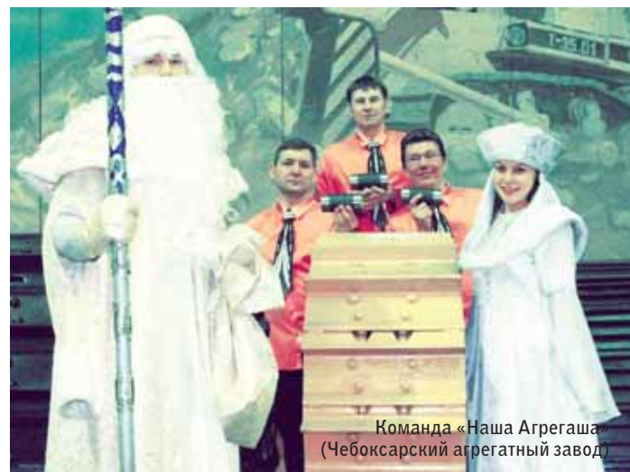
Команда «Наша Агрегаша» (Чебоксарский агрегатный завод)